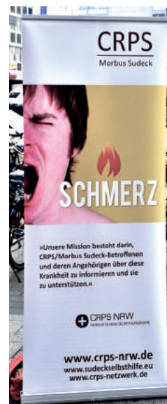
Anzeigen am Timesquare 2017 | CRPS Banner