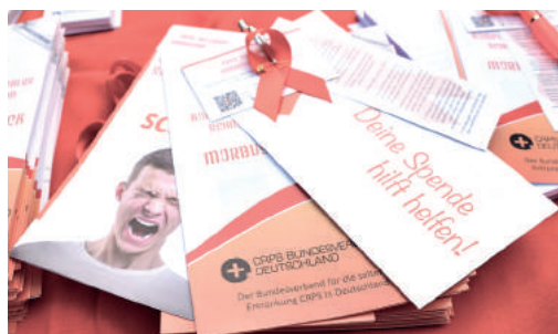
CTWO Flyer 2017

Die vierte Jahresausgabe von „Color The World Orange - Färbe die Welt orange“, unter dem speziellen Motto „Wir können alle orange!“, die darauf abzielt, das Bewusstsein für das komplexe regionale Schmerzsyndrom (CRPS), auch bekannt als Morbus Sudeck, zu verbreiten, ist der 5. November 2018. Die Veranstaltung, die am ersten Montag im November stattfindet, soll die Aufmerksamkeit auf diese kaum verstandene Schmerzstörung lenken.