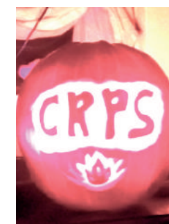
CRPS Kürbis 2017

Das CRPS Netzwerk - Gemeinsam stark ist Teil des CRPS Bundesverband Deutschland e.V. , und ist ein Verbund der CRPS Selbsthilfegruppen in Deutschland, Österreich und Luxemburg. Es hat sich zum Ziel gesetzt, baldmöglichst in jedem deutschsprachigen Bundesland eine regionale Landesgruppe zu etablieren. Da die CRPS Betroffenen ohnehin bereits eine Ärzte- und Klinikodyssee hinter sich haben, können sie sich das Reisen zum nächsten Gruppentreffen bald sparen. Unsere Webseite www.crps-netzwerk.org gibt Auskunft darüber, wo bereits Landesgruppen zu finden sind.