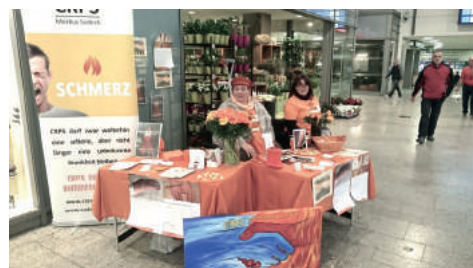
CTWO Infostand Duisburg 2017

Es soll niemand mehr mit Morbus Sudeck in Deutschland ohne ausreichende Information über das Krankheitsbild und vor allem nicht mehr ohne professionelle Hilfe bleiben und CRPS darf zwar weiterhin eine seltene aber nicht länger eine unbekannte Krankheit bleiben.