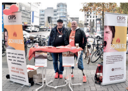
CTWO Infostand Köln 2017

Überall auf der Welt werden Unterstützer orangefarbene und veranstaltende Veranstaltungen tragen, um das Bewusstsein für CRPS/Morbus Sudeck zu schärfen und Mittel zur Unterstützung der Forschung über diese lähmende Krankheit aufzubringen.